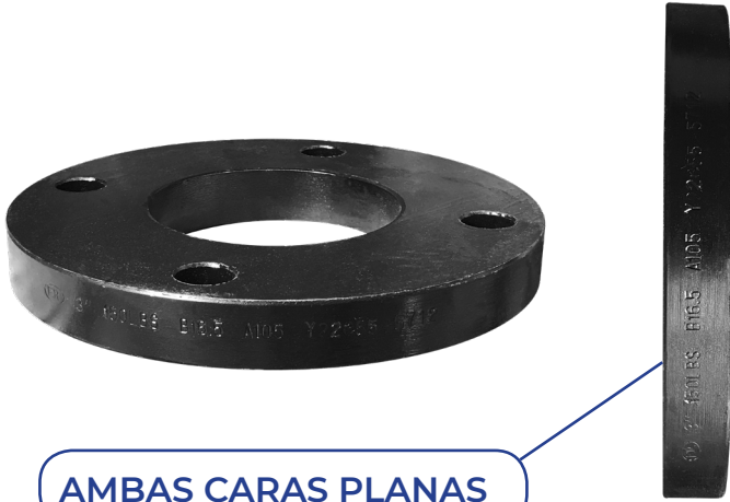
AMBAS CARAS PLANAS